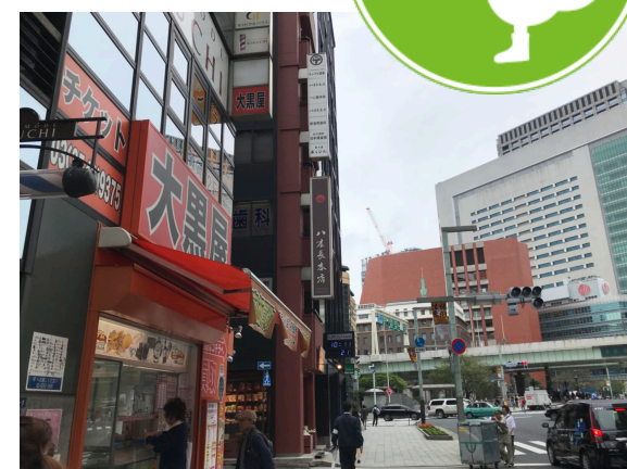
奈良まほろば館を左手に進み大黒屋さんの角を左折します。