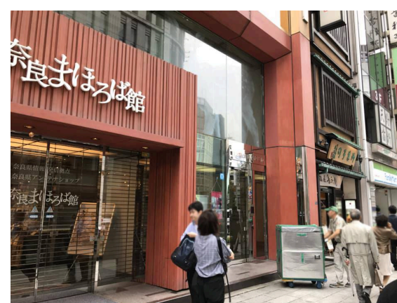
階段を上がると右手に奈良の物産館（奈良まほろば館）が見えます