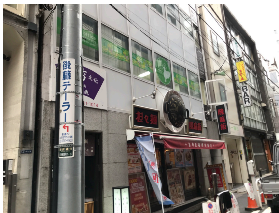
緑のチルドリンカフェのマークが目印です。