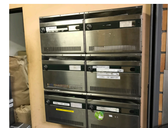
入り口を進み突き当りを左折でポストがあります。その背はエレベーターがあります。2階へ