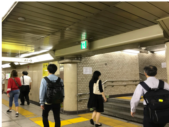
【東京メトロ】銀座線「三越前」駅 (A1出口)