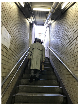
A1の階段を上がります。上がるとバス停が見えます。