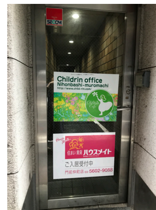
入口は、こちらから